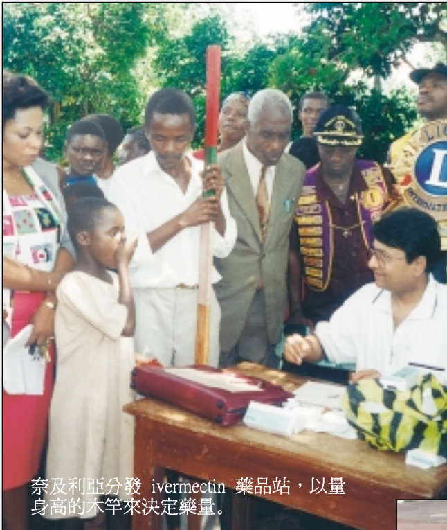
奈及利亞分發 ivermectin 藥品站，以量身高的木竿來決定藥量。

目前 LCIF 與卡特中心合作，每年在非洲醫治一千萬危險群病人。但是我們仍需要您的幫忙，才能為更多的非洲病人醫治。若他們未接受治療，一定會失明的。