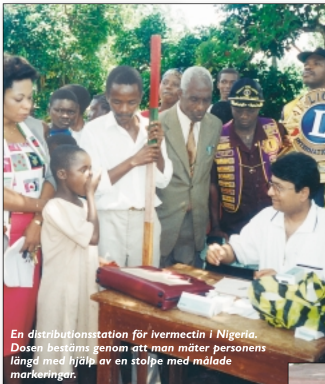
En distributionsstation för ivermectin i Nigeria. Dosen bestäms genom att man mäter personens längd med hjälp av en stolpe med målade markeringar.

LCIF och the Carter Center behandlar varje år 10 miljoner människor i Afrika, som riskerar att bli smittade. Men vi behöver er hjälp för att kunna behandla många fler miljoner människor, som utan tvivel kommer att smittas om vi inte ingriper.