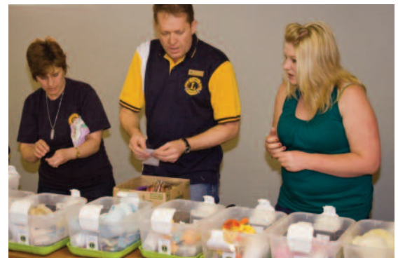
Los socios del Club de Leones Potchefstroom (410-B, Sudáfrica) tienen el cometido de ayudar a los niños víctimas de trauma y a través de su proyecto de servicio les proveen lo que ellos llaman, “Cajas de Amor”. En agosto de 2010, 50 niños recibieron las “Cajas de Amor”, que contienen jabón, toalla, cepillo de dientes, pasta dental, un juguete, libros para colorear, crayones, comida, ropa y mucho más. El club ha servido a los niños de esta manera por cuatro años y sostiene el proyecto gracias a la colaboración de corporaciones patrocinadoras.