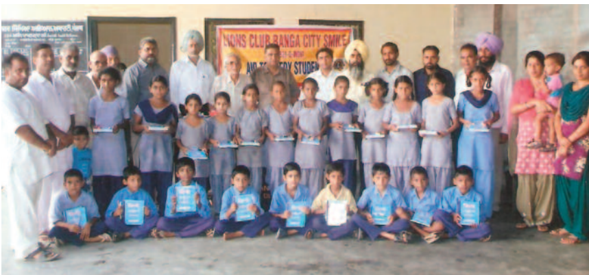
El Club de Leones Banga City Smile (321-D, India) provee útiles escolares a 103 estudiantes. El club se siente complacido de ayudar a los estudiantes de las escuelas primarias públicas.