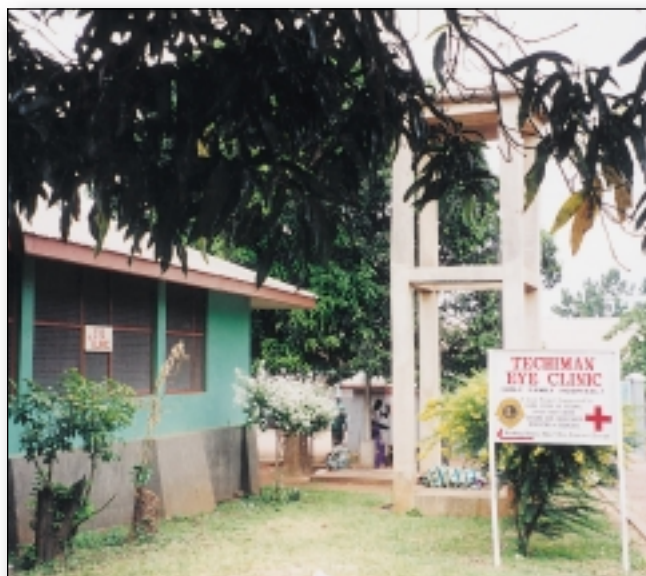
LCIF financia a reforma de hospitais e clínicas como parte da estratégia do Lions de prevenção à cegueira.

As despesas administrativas de LCIF são inferiores a 9% – um recorde extraordinário entre todas as organizações beneficentes.