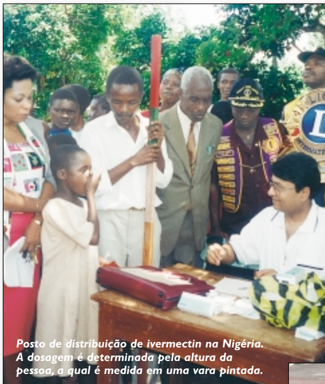
Posto de distribuição de ivermectin na Nigéria. A dosagem é determinada pela altura da pessoa, a qual é medida em uma vara pintada.

No momento, LCIF e o Centro Carter estão tratando anualmente de 8 milhões de pessoas em risco na África. Mas a sua ajuda é necessária para tratar de milhões de outras pessoas na África que certamente ficarão contaminadas a não ser que contem com a nossa intervenção.