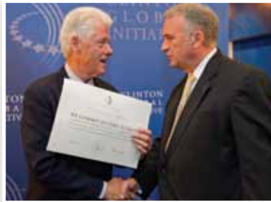
국제재단은 클린터 글로벌 이니셔티브와 협력합니다.