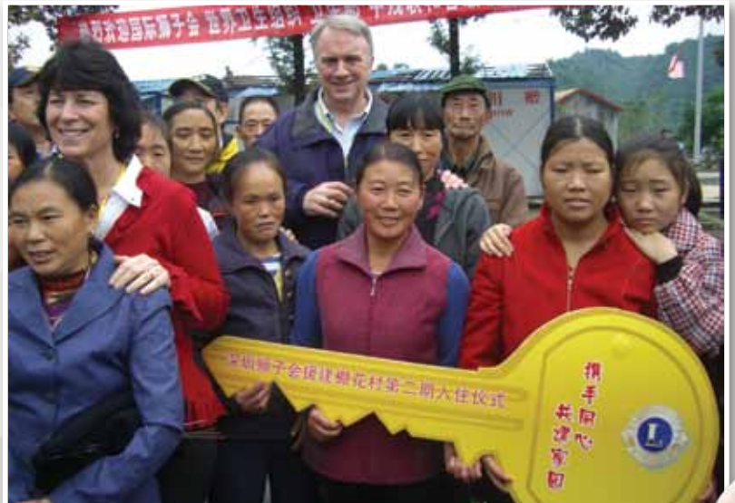
중국 시추안 성에서 수많은 가족들이 새 집 열쇠를 받고 있습니다.