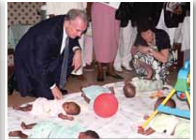
부르키나 파소의 고아원이 HIV/AIDS에 걸린 유아들에게 집을 제공하고 있습니다.