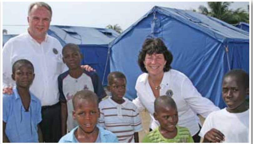
국제재단은 아이티에서 가족들을 위한 쉼터를 제공하고 있습니다.