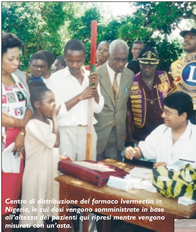
Centro di distribuzione del farmaco Ivermectin in Nigeria, le cui dosi vengono somministrate in base all’altezza dei pazienti qui ripresi mentre vengono misurati con un’asta.

In Africa, attualmente la LCIF ed il Centro Carter ogni anno curano 10 milioni di persone a rischio. È, però, necessario il vostro aiuto per gli altri milioni di persone che contrarranno tale male senza il nostro intervento.