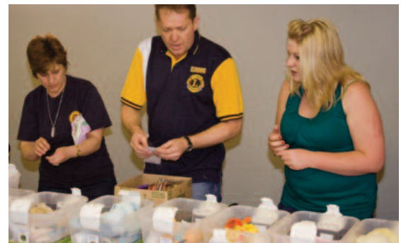
Les membres du Lions Club de Potchefstroom (410-B, Afrique du Sud) se sont engagés à donner aux enfants qui ont subi une expérience traumatisante des colis de provisions qu'ils appellent des "boîtes d'amour". En août 2010, 50 enfant ont reçu une "boîte d'amour" qui contenait une tablette de savon, une débarbouillette, une brosse à dent, un tube de dentifrice, un jouet en peluche, un livre à colorier et des crayons de couleur, des flocons d'avoine, des vêtements et d'autres provisions. Le club aide les enfants de cette façon depuis quatre ans et obtient le soutien de certaines entreprises pour assurer la durabilité du projet.