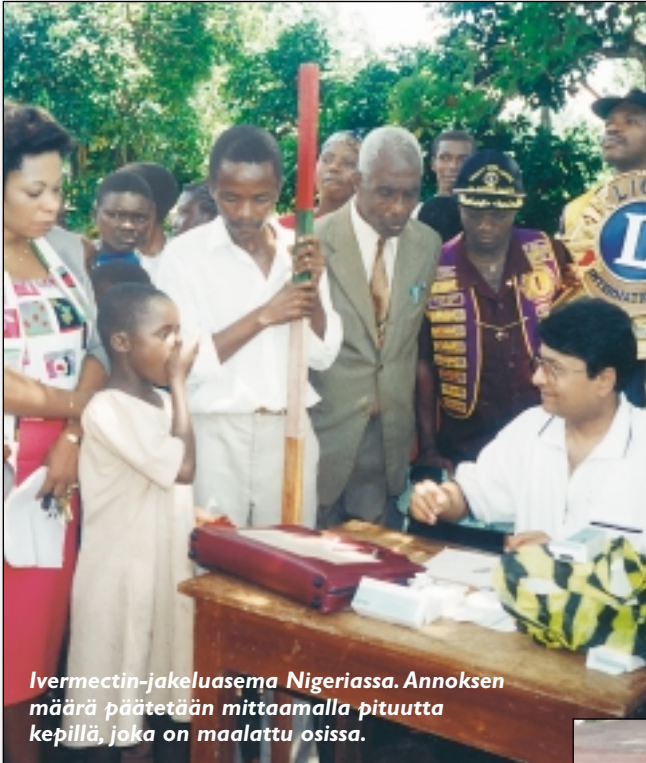
Ivermectin-jakeluasema Nigeriassa. Annoksen määrä päätetään mittaamalla pituutta kepillä, joka on maalattu osissa.

Nykyisin LCIF ja Carter Center hoitavat 10 miljoonaa vaarassa olevaa ihmistä vuosittain Afrikassa. Mutta sinun apuasi tarvitaan Afrikassa miljoonien muiden hoitamiseksi, jotka epäilemättä saavat tartunnan, jos me emme puutu asiaan.