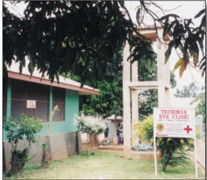
LCIF tukee sairaalojen ja klinikoiden kunnostamista osana lionien monipuolista sokeuden estämisstrategiaa.